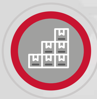
OTTIMIZZAZIONE DELLO SPAZIO