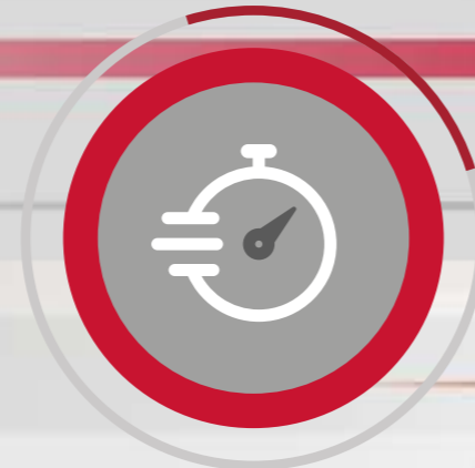
VELOCITÀ DI MOVIMENTAZIONE